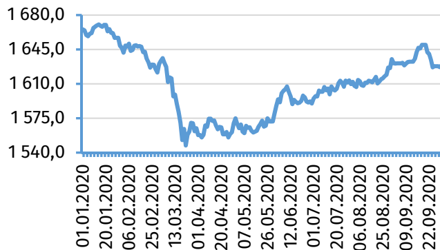
Рис. 2. Динамика индекса EM Currency, долл. США

Ослабление национальной денежной единицы было также зафиксировано на валютном рынке Украины (на 0,5% за октябрь и на 20,1% с начала года) и Республики Молдова (на 0,4% за октябрь, с начала года укрепление на 1,0%)